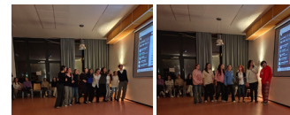
Zdjęcia: Ostatni wieczór

Spotkania odbywały się w dniach 24-27 listopada w Wiesbaden. 35 laureatów nagród w wieku od 14 do 18 lat z Hesji i jej regionów partnerskich: Emilia-Romania, Nowa Akwitania i Wielkopolska wykorzystali te dni, aby lepiej się poznać dzięki urozmaiconemu programowi imprezy.