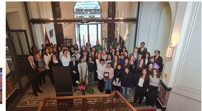
Zdjęcie grupowe w Kancelarii Państwowej